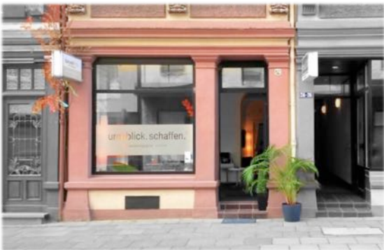
unsere Praxisräume in Köln-Mitte

Gibt es eine bessere Form, mit dem Leben fertig zu werden, als mit Liebe und Humor? Charles Dickens